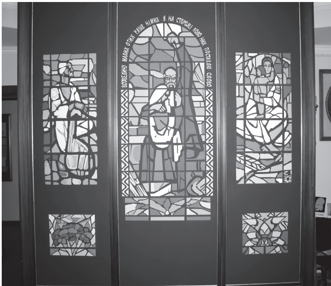
Вітраж «Тарас Шевченко. Мати» у Музеї шістдесятництва, відновлений за авторськими ескізами.