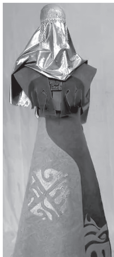
Костюми «Полин» і «Сарматка» з колекції «Скіфський степ» (1993–1996 рр.) та кептарі бароко.

Над занудою сірості, гвалтом парадності І над сказом стиляг в екстатичній юрбі Ти, богиня шляхетності, грації й радості, Декретуєш красу в світ, підвладний Тобі. Ти виструнчуєш покруча, причепурюєш голого, Відживляєш заляклого, прозріваєш сліпця. І до Тебе, як соняхи, тягнуться голови, Незадублені душі, незатерплі серця. Мов прочани, ідуть за Тобою, богинею! Може, Ти їх врятуєш, може, Ти їм даси Як останню надію, як лік від загину їм Правду чесною гідності, первородство краси. Бо життя їм немає. Бо куди себе діти їм? Їх погноєм, підніжжям творив Всеблагий. А могли б Аполлонами. А могли б Афродітами. Як князі між князями. Між богами боги. Та боялись. Ховались. Не вміли. Не вабило. Подобизною Божою, маєстатом віків, Хоронили себе, убієнні єдвабами, В пантеонах панбархатів, в саркофагах шовків. Глянь, богине, і зглянься, як скрутно і туго їм, Одволодай їх, випростай, розігни Їх, в мундири зачохлених, облачених папугами, В однострої ув'язнених. Відживи! Онови! Ти їх вивільни з рабства монументальності, З летаргії парадності і суєти, Дай їм вічність свободи і свободу ментальності, Зачаруй їх магією простоти. З Аполлонів зачуханих, з Афродіт занехаяних Поздирай хохлому й балахоння хламид. Одягни їх у себе самих – і нехай вони Бачать Боже єство і пречистий свій вид. І нехай у осліплених, і нехай у окрадених Грають, повняються вигублені серця Первородно людськими свободами й правдами. Святом свят. І нехай їм не буде кінець.