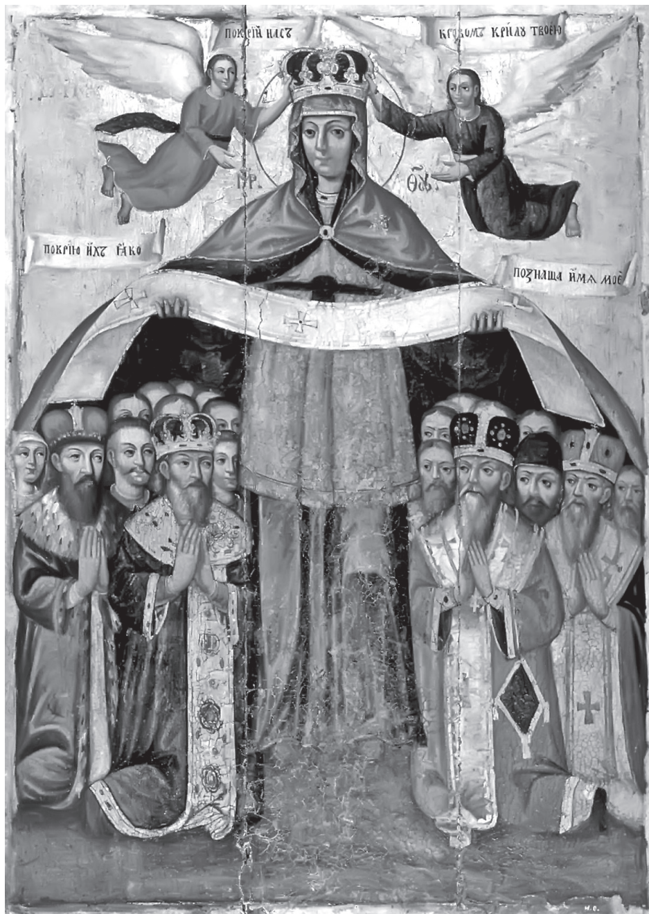
Ікона «Покрова Богородиці» із зображенням невідомого козацького старшини – ліворуч у гурті. XVII ст. Київщина.