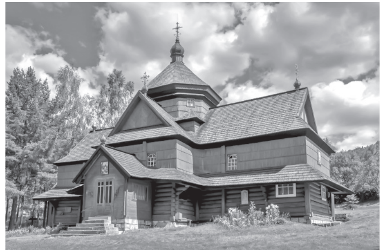
Церква Різдва Пресвятої Богородиці у Криворівні.

Разом із парохом та мешканцями Криворівні в церкві Різдва Пресвятої Богородиці молилися Іван Франко, Михайло Грушевський, Михайло Коцюбинський, Гнат Хоткевич, Леся Українка та багато інших визначних постатей української культури, яким симпатизував і радо гостив у плебанії (церковному будинку) отець Олексій Волянський. Сьогодні на стіні плебанії розміщено дві меморіальні дошки про те, що в «Сонячній хаті» (як її було названо з легкої руки Михайла Коцюбинського) перебували визначні гості.