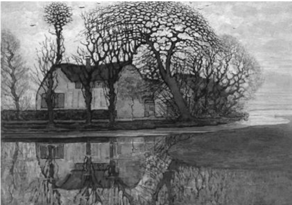
Твір Піта Мондріана

Людина створена за образом і подобою Божою. Це ж не просто логічна формула. Це велика сокровенна тайна й правда. Вона промовляє. У ній чути – невідомий, вільний, страшний, вічний, благословенний шлях... «істини і життя».