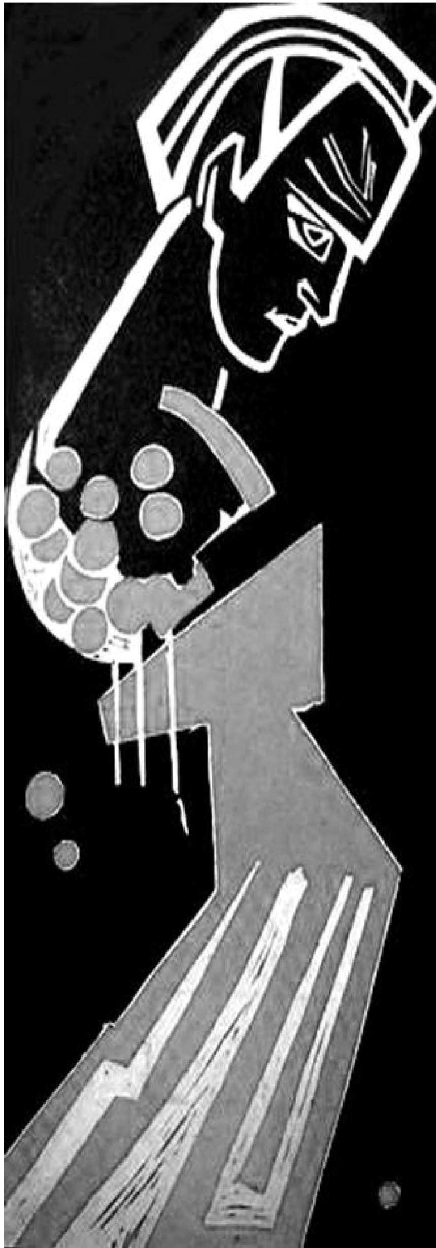
Портрет Василя Симоненка роботи Алли ГОРСЬКОЇ

Попри це художню манеру Алли Горської жодною мірою не можна запідозрити в орнаменталізмі чи надмірному естетизмові. В її інтерпретації так звана тематична «калиновість» на полотні сприймається не як традиційне зображення, а як щось дуже модерне й навіть авангардне. Алла Горська тут (власне, як і завжди) постає радше художником ідеї, що набирає форм яскравого національного образу. Лінії мисткині потужні, лаконічні й строї, а з тим – і дуже виразні. Годі й уявити, що можна щось додати до зображеного чи знайти на ньому зайве. Трагічність, жертвовність і неупокореність В.Симоненка, а з ним – і України – ось власне та провідна думка, що променіє в цій картині. Подібно прочитується і її колористика – червоне й чорне з абрисами кольору слонової кістки – як журба і радість, життя і смерть у сконденсованому лаконізмі символічного вияву. Що ж до модерністської стилістики цієї роботи, про яку писала Ірина Жиленко, то динаміка й стрімкість її ліній, як і її образність, дає підстави говорити також про авангардний спосіб образного мислення художниці, елементи якого спостерігаються й у її знаменитих монументальних розписах. Утім, без сумніву, портрет Василя Симоненка роботи Алли Горської і за своїм смисловим наповненням, і за стилістикою й технікою виконання бачиться одним із глибоких, яскравих і характерних мистецьких образів шістдесятництва.