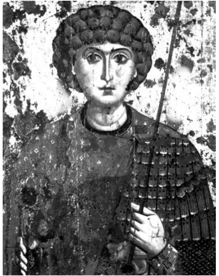
Георгій-воїн. 11-12 ст.

Юрей ФЕОДОСІЙ (АЛІСОВ) Свято-Покровський козацький храм, УПЦ КП м. Дніпродзержинськ (Кам'янське)