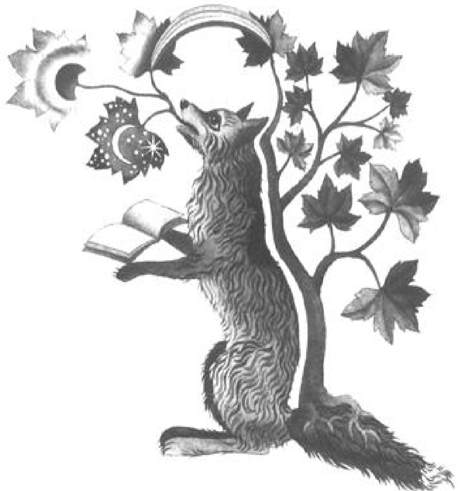
Тут та на стор. 8 твори Вікторії Ковальчук

Слово — це зерно, твій засів у вічність.