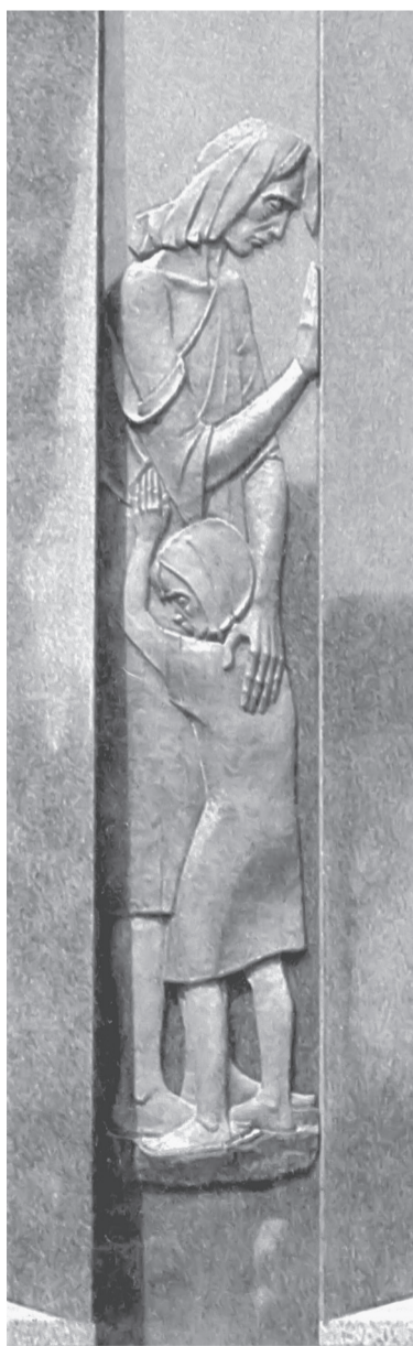
Меморіал Голодомору у Вінніпезі (Канада). Скульптор Роман Коваль

«Національна Трибуна», ч. 13 (1405), 3 квітня 2011 р.